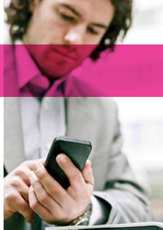
Figure 1. Gamme de solutions de communication Alcatel-Lucent Office

Notre gamme de solutions est fiable, ouverte et basée sur les normes du secteur. La modularité est présente à tous les niveaux des solutions de communication Alcatel-Lucent Office, depuis la suite de communication et les licences logicielles jusqu'au serveur de communication et à l'infrastructure de réseau qui répondent parfaitement aux exigences des clients. Avec notre gamme de solutions, vous pouvez obtenir une garantie matérielle et de nombreux services, du simple contrat de maintenance à un système complet comportant de nouvelles applications et technologies. Les solutions de communication Alcatel-Lucent Office sont en avance sur leur temps et s'appuient sur un serveur de communication sur IP qui utilise des protocoles standard et offre de puissantes fonctionnalités.