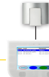
Terminal de chambre Appel malade