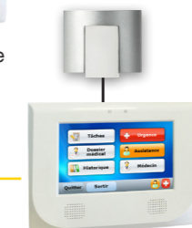
Terminal de chambre Appel malade et Gestion des soins