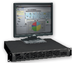
Serveur de gestion Ackermann