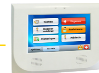
Terminal de chambre Gestion des soins